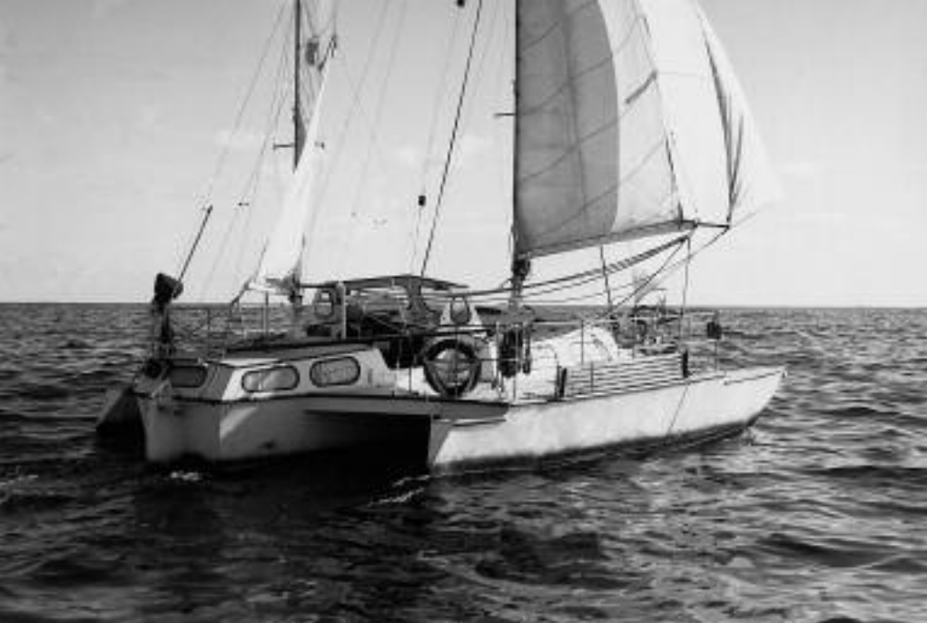
Der Trimaran ULTIMA RATIO mit Kurs Karibische Inseln