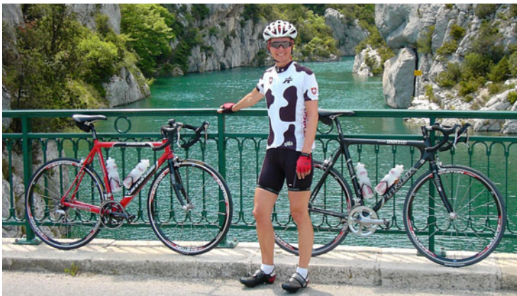
Brücke über den Verdon bei Quinson.

Hinter Baudinard führt der Weg noch einmal kurz bergauf, danach fährt man zügig auf leicht welligem Terrain ohne Schwierigkeiten, an Eichenwald vorbei, nach Moissac-Bellevue , dessen Parkplatz nun von Norden kommend erreicht wird.