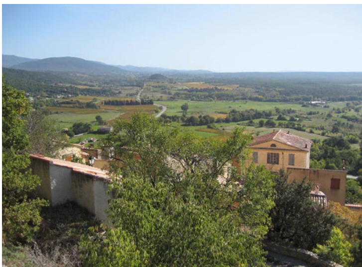
Moissac-Bellevue macht seinem Namen alle Ehre. Hier die fantastische Aussicht Richtung Aups.