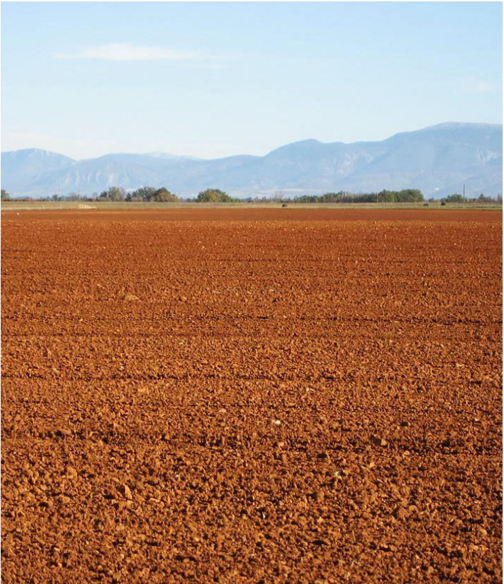
Hochebene zwischen Quinson und Esparron-du-Verdon.