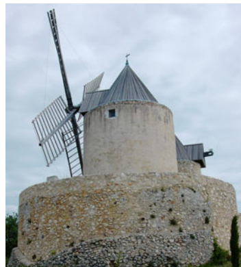
Die Windmühlen von Régusse.

nach Quinson zu gelangen. Kurz vor dem Ortsschild von Quinson , am Ende einer kleinen Abfahrt, sollten Sie unbedingt auf der Brücke über den Verdon-Fluss anhalten und den wunderbaren Blick in den unteren Teil des Canyons mit dem