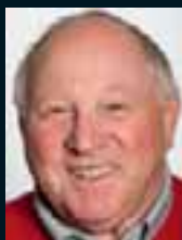
Uwe Seeler ..... 173 »Achtung, Uwe leuchtet!«