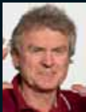
Sepp Maier ..... 107 »Uli Hoeneß hat mir das Leben gerettet.«