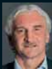
Rudi Völler ..... 185 »Den schickst du in den ersten zehn Minuten gleich dreimal auf die Aschenbahn.«