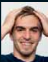
Philipp Lahm ..... 77 »Ich bin absolut privilegiert, das ist mir völlig klar.«