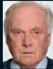
Udo Lattek ..... 83 »Wenn es einen Gott geben würde, wäre er gerecht.«