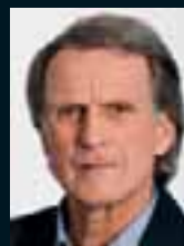
Wolfgang Overath ..... 143 »Golf? Ich spiele immer noch Fußball.«