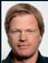
Oliver Kahn ..... 65 »Anerkennung bekommst du nicht nur durch sportlichen Erfolg.«