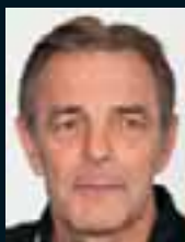
Karl-Heinz Körbel ..... 71 »Johan Cruyff erteilte mir die größte Lehrstunde.«