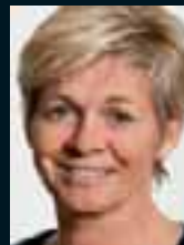
Silvia Neid ..... 131 »So, Mädels, jetzt laufen wir noch mal extra vor und zurück.«