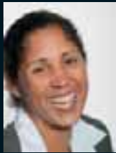
Steffi Jones ..... 59 »Mein Werkzeugkasten ist professionell.«