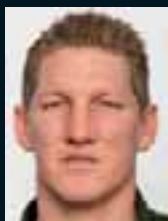
Bastian Schweinsteiger ..... 167 »Den Schweini gibt's nicht mehr.«