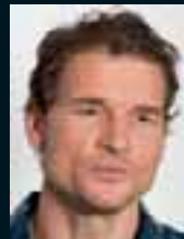
Jens Lehmann ..... 89 »Auf dem Platz kennst du irgendwann keine Verwandten mehr.«