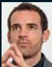
Christoph Metzelder ... 119 »Das Ausloten der eigenen Grenzen war sehr wichtig.«