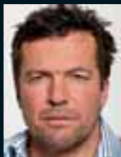
Lothar Matthäus ..... 113 »Irgendwo erwartest du auch mal ein bisschen Hilfe.«