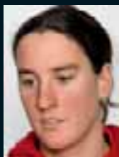
Birgit Prinz ..... 155 »Ich habe eben keine Lust, mich zu verkaufen.«