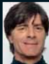
Joachim Löw ..... 95 »Ich musste lernen, mich vom Fußball zu befreien.«