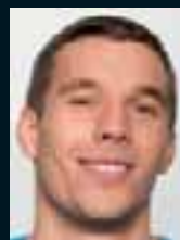
Lukas Podolski ..... 149 »... dann bin ich eben ungewöhnlich.«