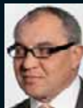
Felix Magath ..... 101 »Ja, ich hatte im Fach Fußball eine 5.«