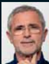
Gerd Müller ..... 125 »Heute könnte ich noch mehr Tore erzielen.«