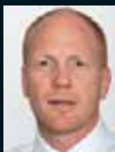
Matthias Sammer ..... 161 »Persönlichkeit ist das Allerwichtigste.«