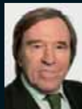
Günter Netzer ..... 137 »Ich verbiete jedem zu sagen, ich sei Welt- meister.«